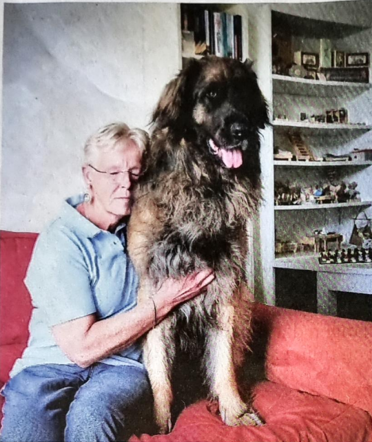
beeld Sjaak Verboom